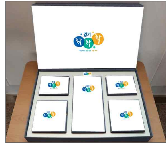
[설상품 패키지 예시]